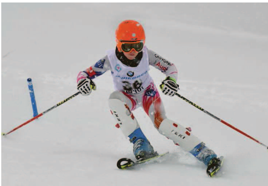
Die Kids zeigten beim Talentecup starke Leistungen.

Anschliessend stand um 14 Uhr der Höhepunkt des Heid-