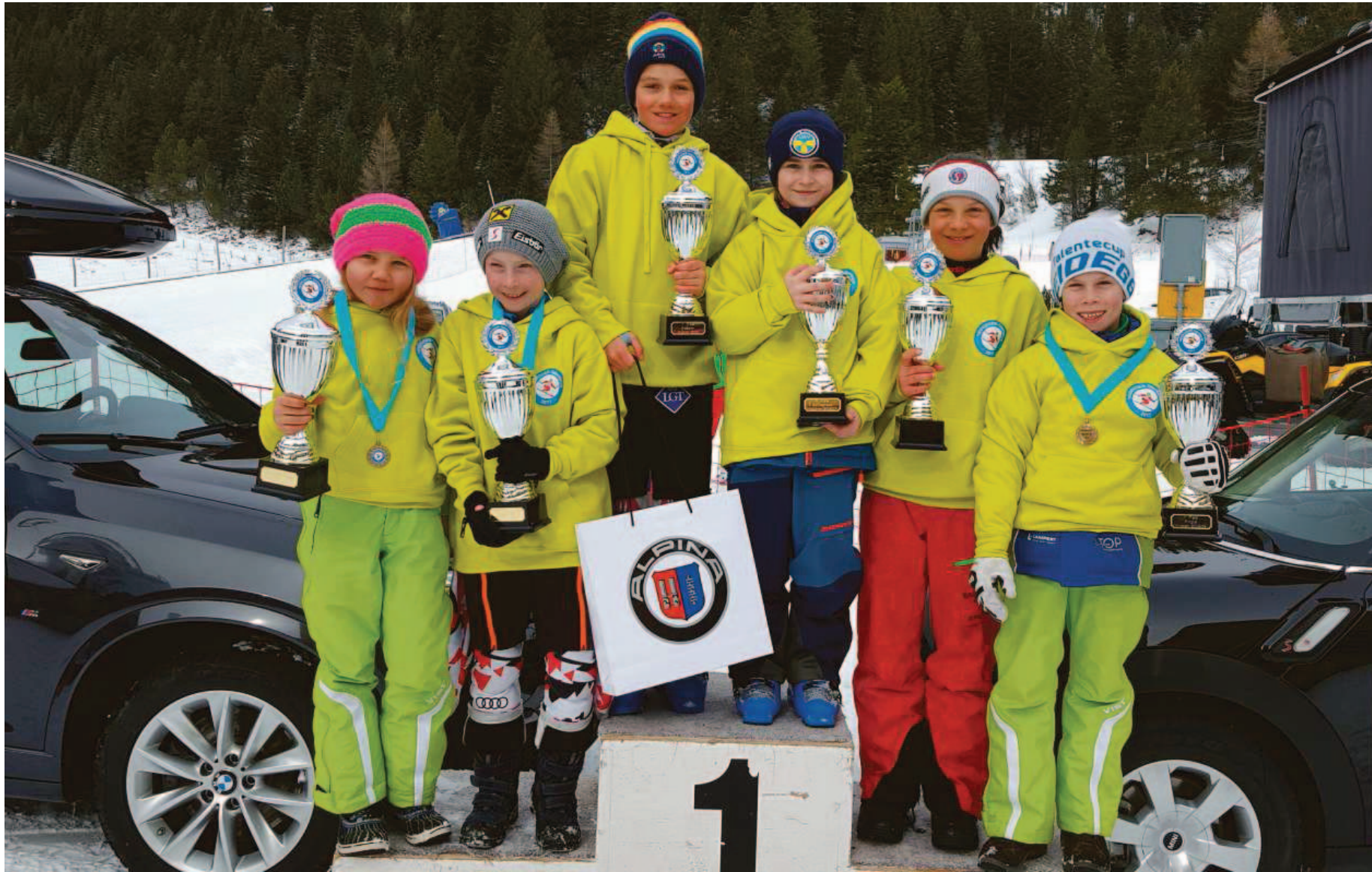
Stolz posieren die Siegerinnen und Sieger mit ihren Pokalen.